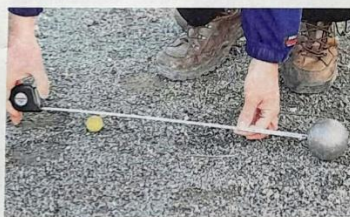
Manchmal geht es eng zu beim Boule.

Die oberen Parkanlagen nahe der Innenstadt dienen dabei nicht nur als Spielfläche, sondern als Treffpunkt. Denn das beliebte Kugelspiel gehört in