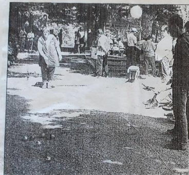
Spielszene vom Boule-Turnier, das am Sonntagnachmittag bei schönstem Sommerwetter am Biergarten dem Normannplatz unter 21 Teams ausgetragen wurde.