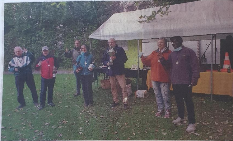
SV ALFELD BOULE